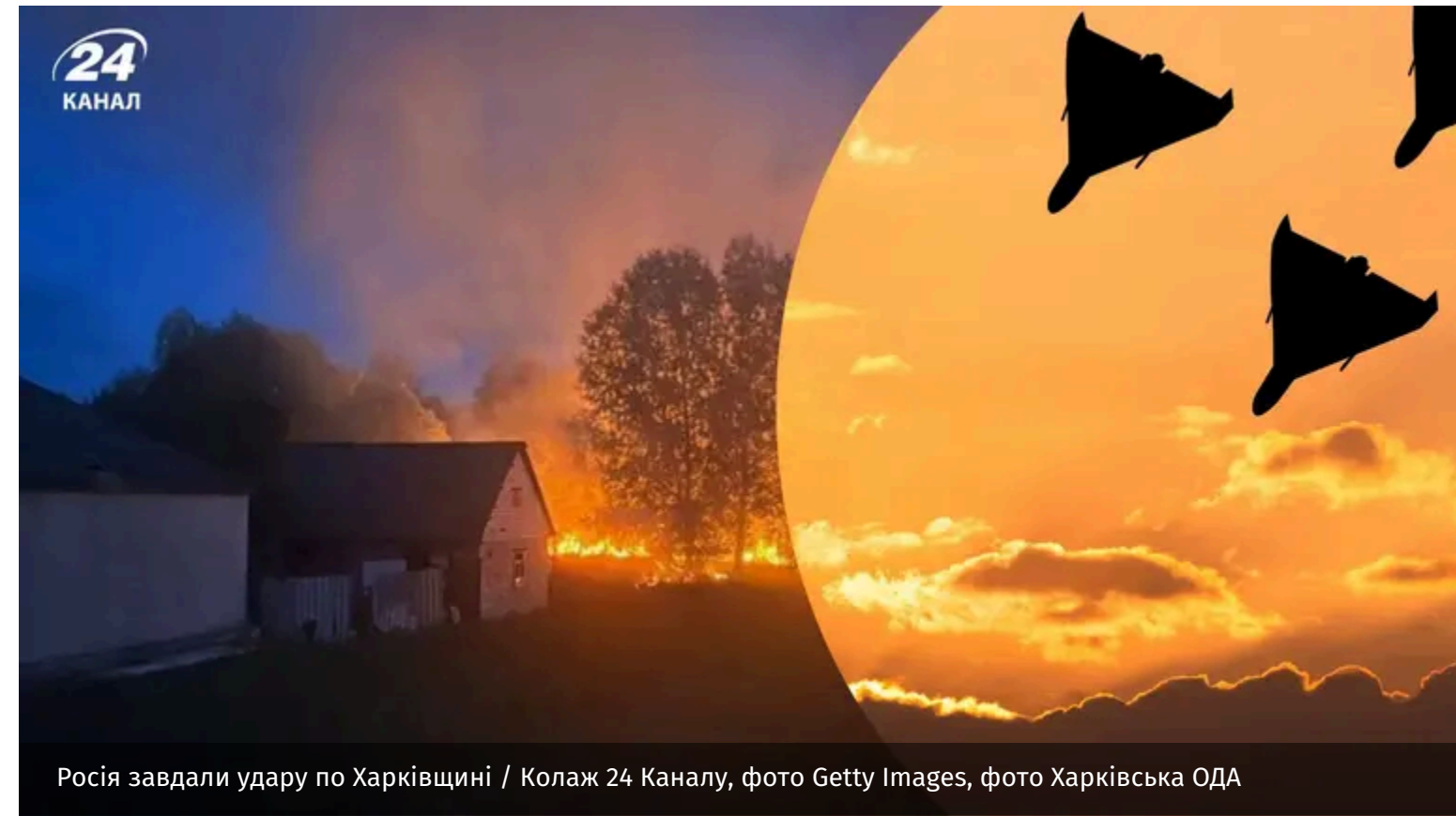
Росія завдали удару по Харківщині / Колаж: 24 Каналу, фото Getty Images, фото Харківська ОДА

Окупанти вкотре тероризують дронами українські міста та села. Ворог атакував Балаклію, що у Харківській області.