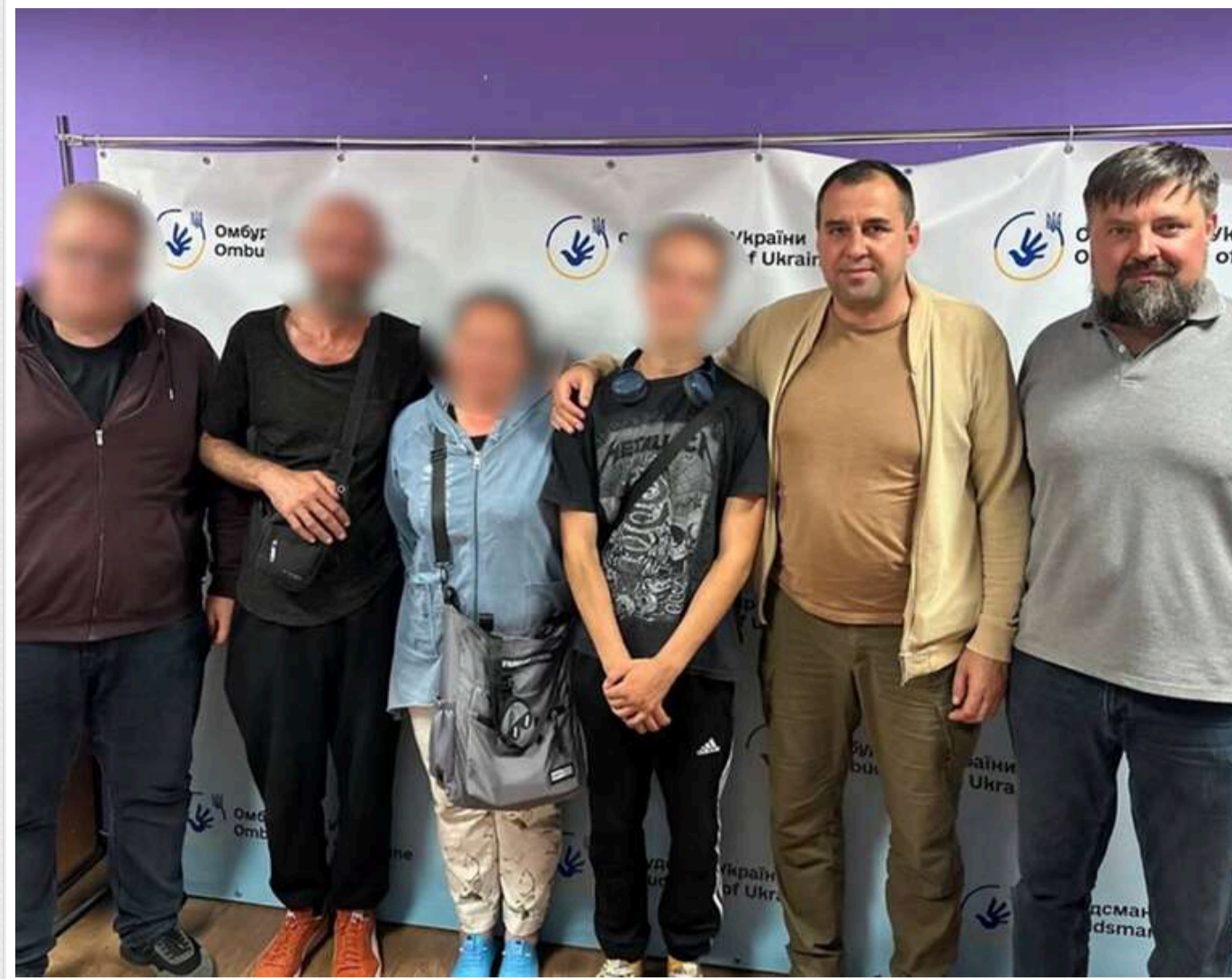
Перевірка ТЦК у Миколаєві: Лубінець заявив про системні порушення та звільнення шістьох утримуваних

Представники Уповноваженого Верховної Ради з прав людини здійснили перевірку в Миколаївському обласному ТЦК та СП після звернення родичів мобілізованого чоловіка, який майже три тижні не виходив на зв'язок.