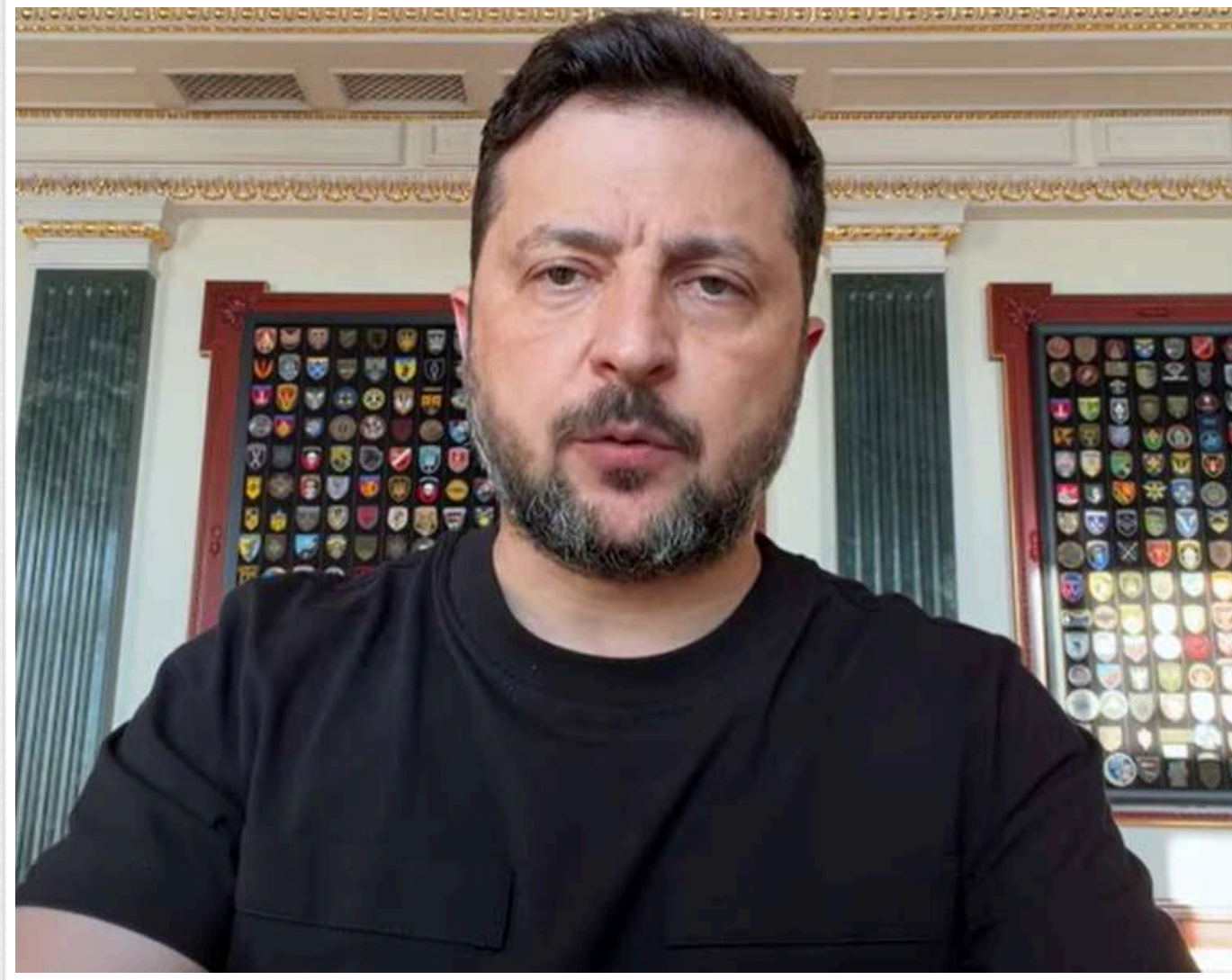
Кожен день видно, що українська влучність працює, - Зеленський про роботу далекобійної зброї

Президент Володимир Зеленський наголосив на високій ефективності української далекобійної зброї під час ударів по російських цілях. За його словами, результати щоденної роботи українських підрозділів підтверджують точність цих атак, а посилений тиск на Росію має змусити Кремль погодитися на реальні переговори про завершення війни.