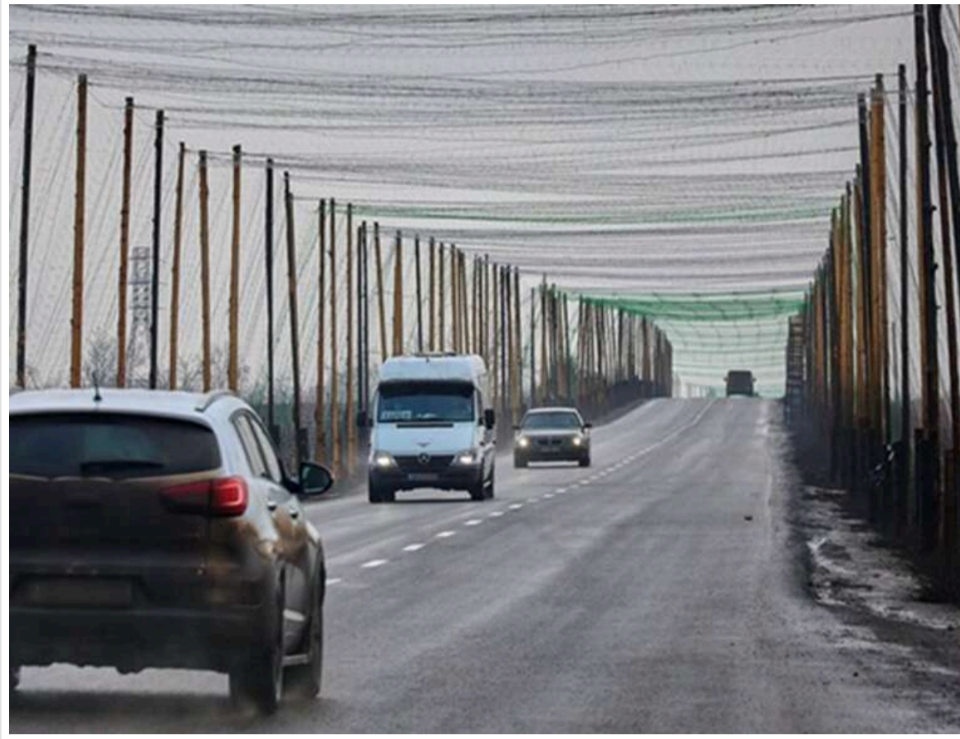
Системи РЕБ уже дають результат: Для захисту Харкова від безпілотників почали встановлювати антидронові сітки

Читати на руськом Read in English Додати як бажане джерело в Google