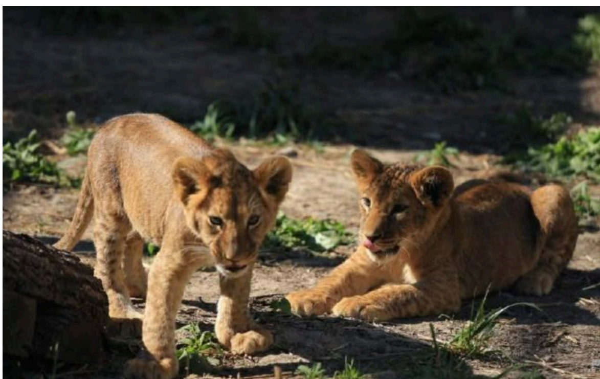
Фото: тварини, що живуть в Фельдман Екопарку