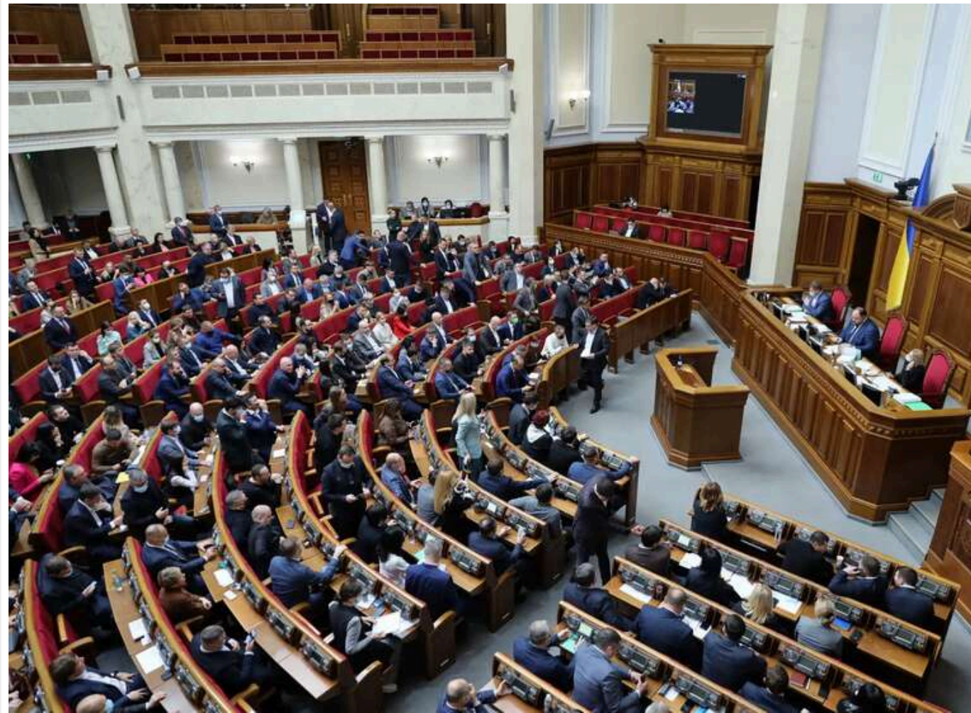
«Рада зламалася»: в монобільшості заявляють про масове невдоволення та можливі відставки