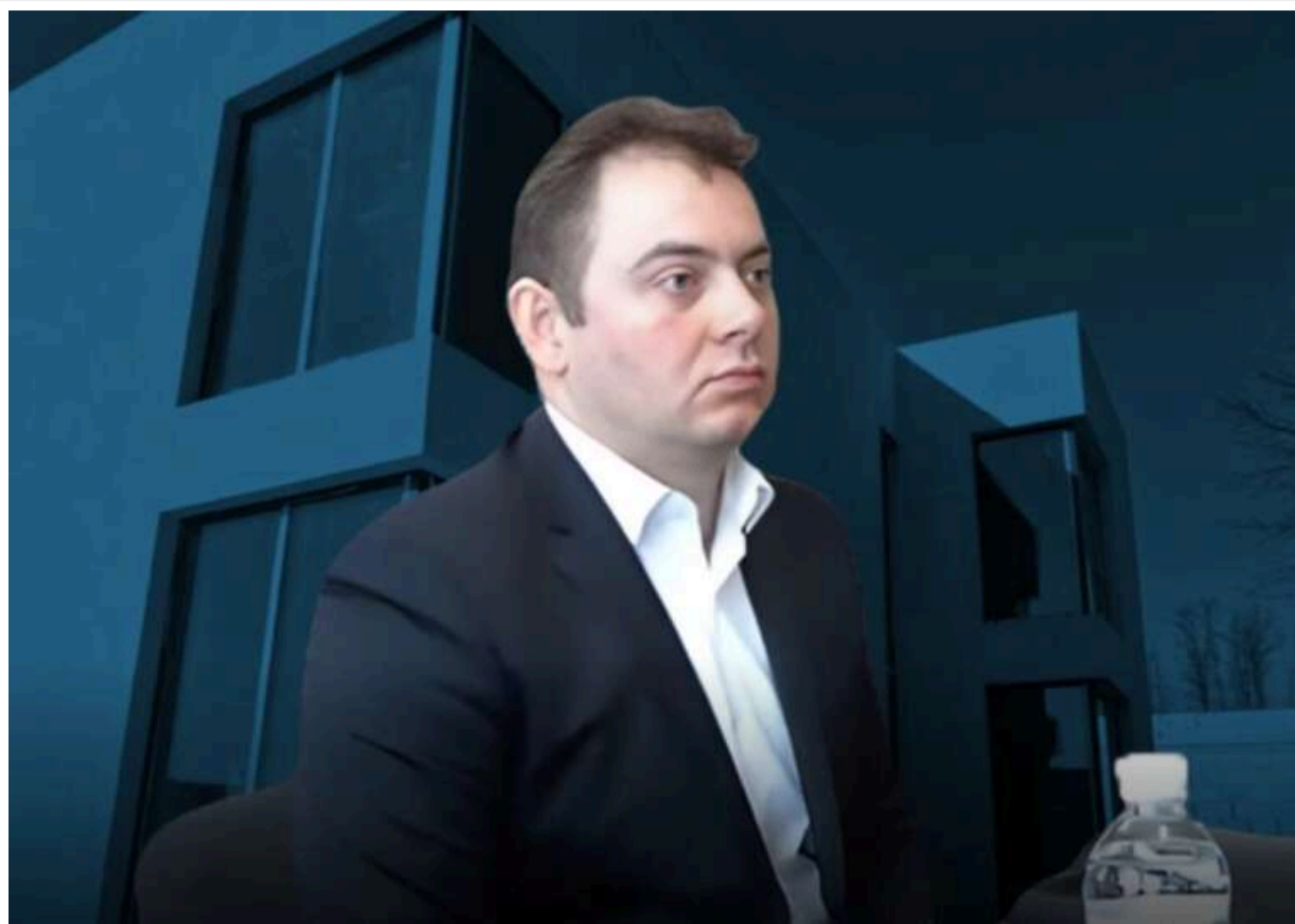
Котедж-невидимка за 200 тисяч доларів: як "суддя Майдану" Віталій Українець будував дім чотири роки, забуваючи вносити його у звіти

Читати на руськом Read in English Додати як бажане джерело в Google