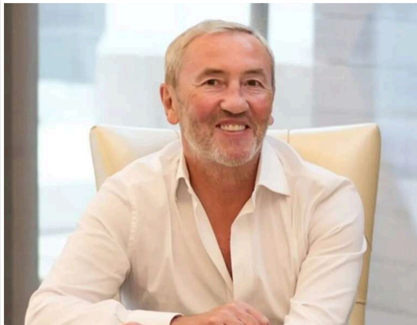
Проросійські заяви – нуль відповідальності: Клан ексмера Черновецького продовжує контролювати землю, забудову й гроші столиці

Колишній мер Києва Леонід Черновецький після вторгнення РФ заявляє, що війни немає – лише «спецоперація з примушення ідіотів до переговорів».