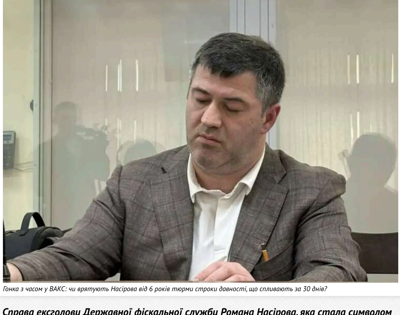
Гонка з часом у ВАКС: чи врятує Насірова від 6 років тюрми строки давності, що спливають за 30 днів?

Читати на руському Read in English Додати м.бланк електронно в Google