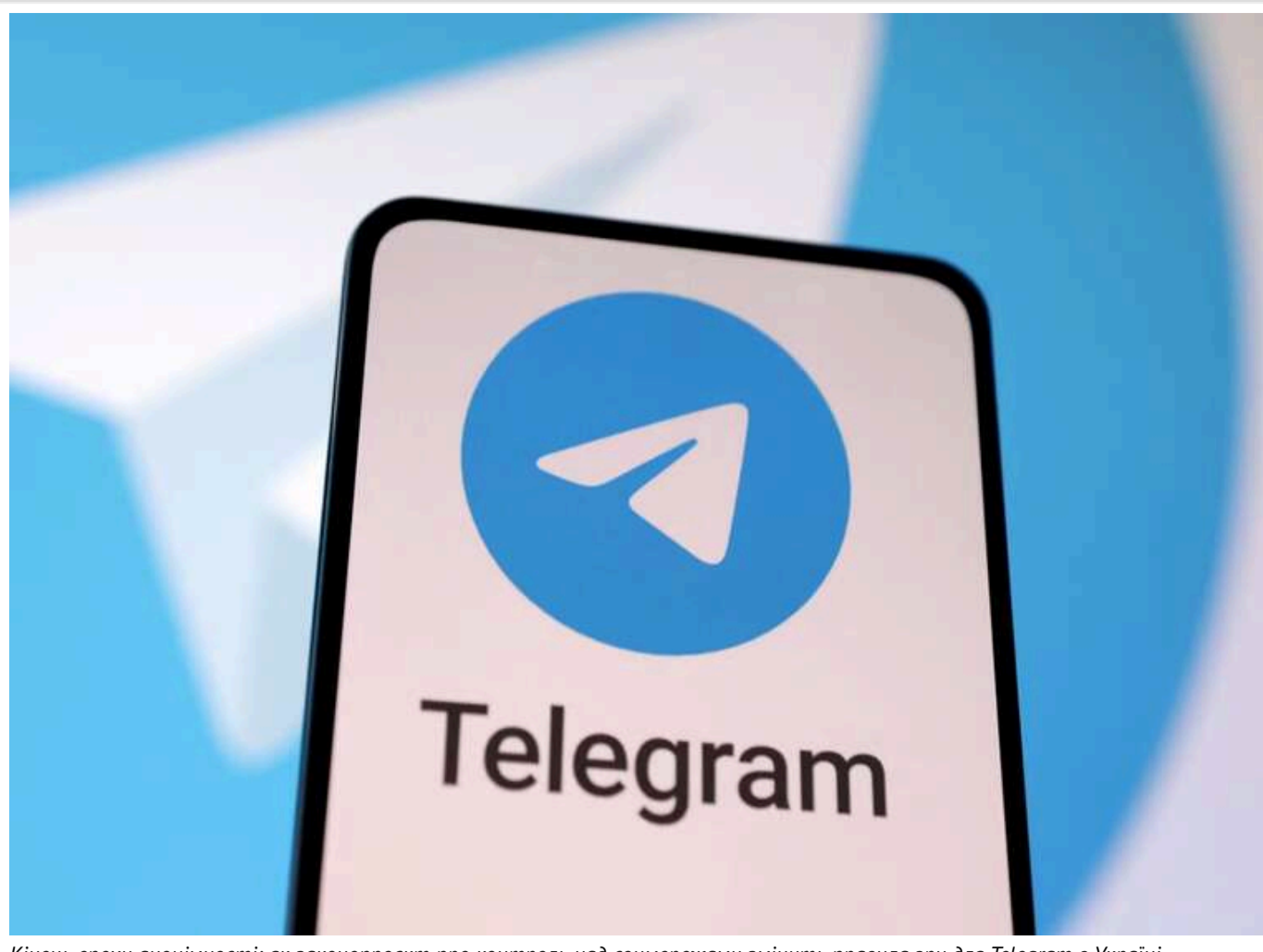
Кінець епохи анонімності: як законопроект про контроль над соцмережами змінить правила гри для Telegram в Україні

Читати на руському Read in English Додати ек-бжане джерело в Google