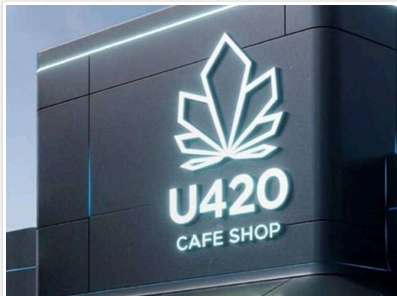
Заборонені речовини під виглядом сувенірів: у Львові перевіряють мережу U420 після виявлення наркотиків у товарі

У Львові поліція проводить перевірку мережі магазинів U420 після журналістського розслідування, яке виявило продаж товарів з ознаками психотропних речовин. За даними місцевих депутатів, такі продукти могли вільно купувати навіть неповнолітні.