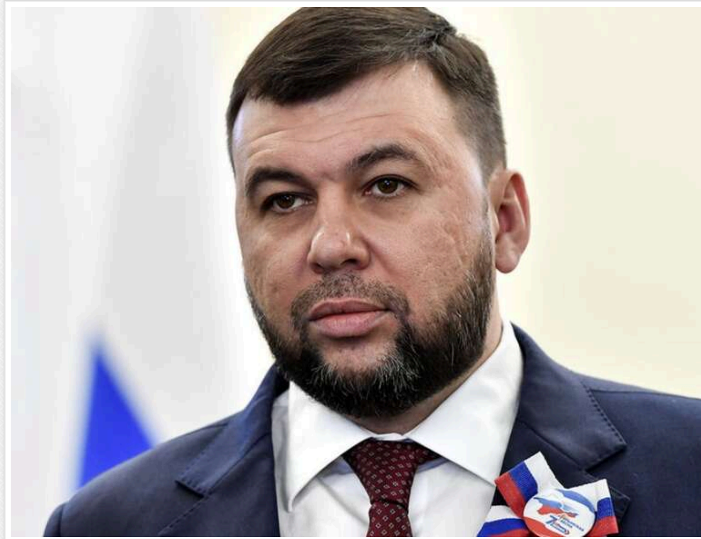
Ватажок "ДНР" Пушилін звинуватив ЗСУ в затягуванні відновлення каналу Сіверський Донець – Донбас

ЗСУ хочуть затягнути час відновлення каналу Сіверський Донець - Донбас після його «звільнення» російськими силами.