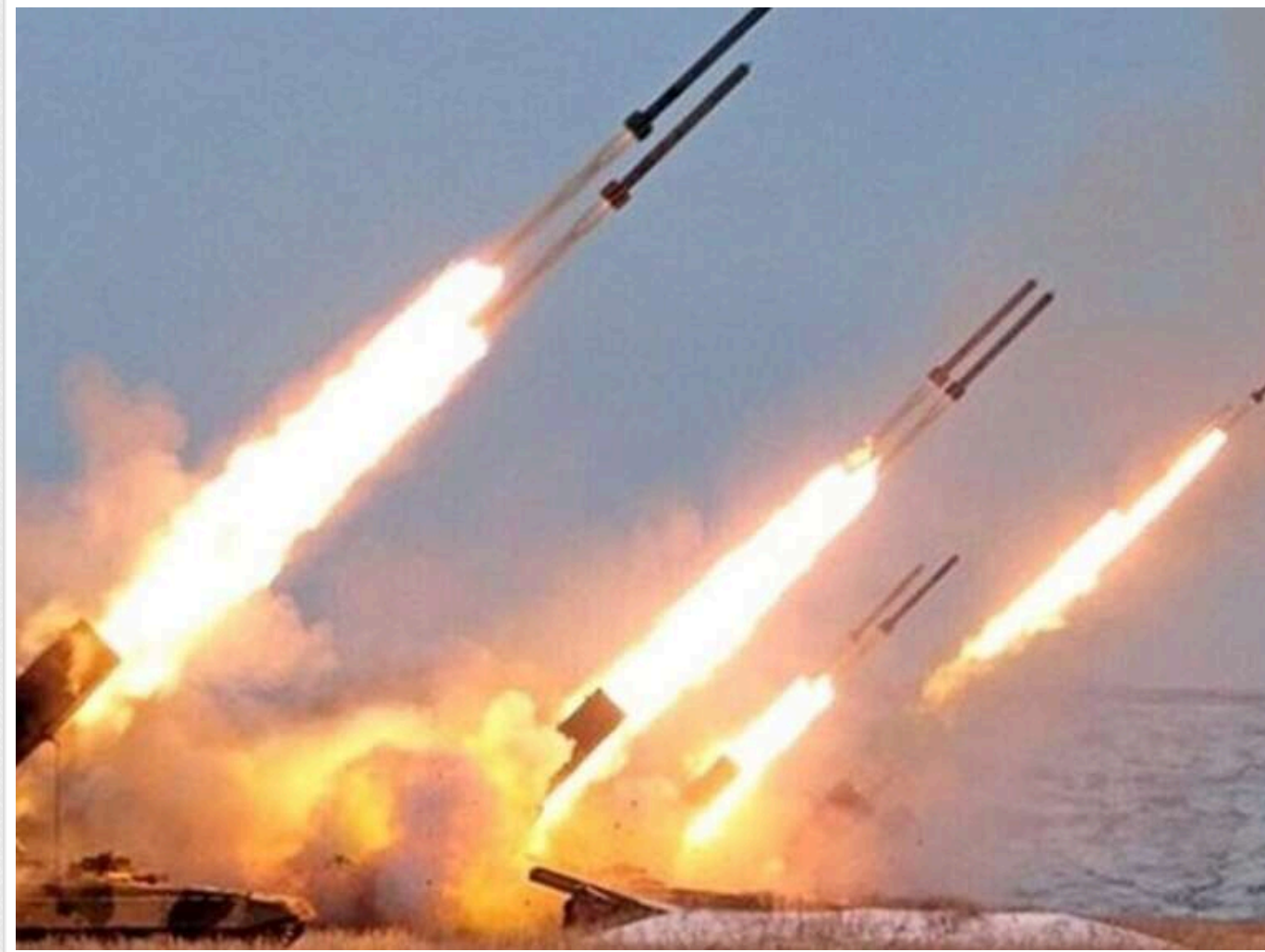
Українські удари скоротили виробництво ракет РФ на 40% і експорт нафти на 45%, – ЦПД

Українські удари по об'єктах у РФ суттєво зменшили виробництво ракет і скоротили експорт російської нафти.