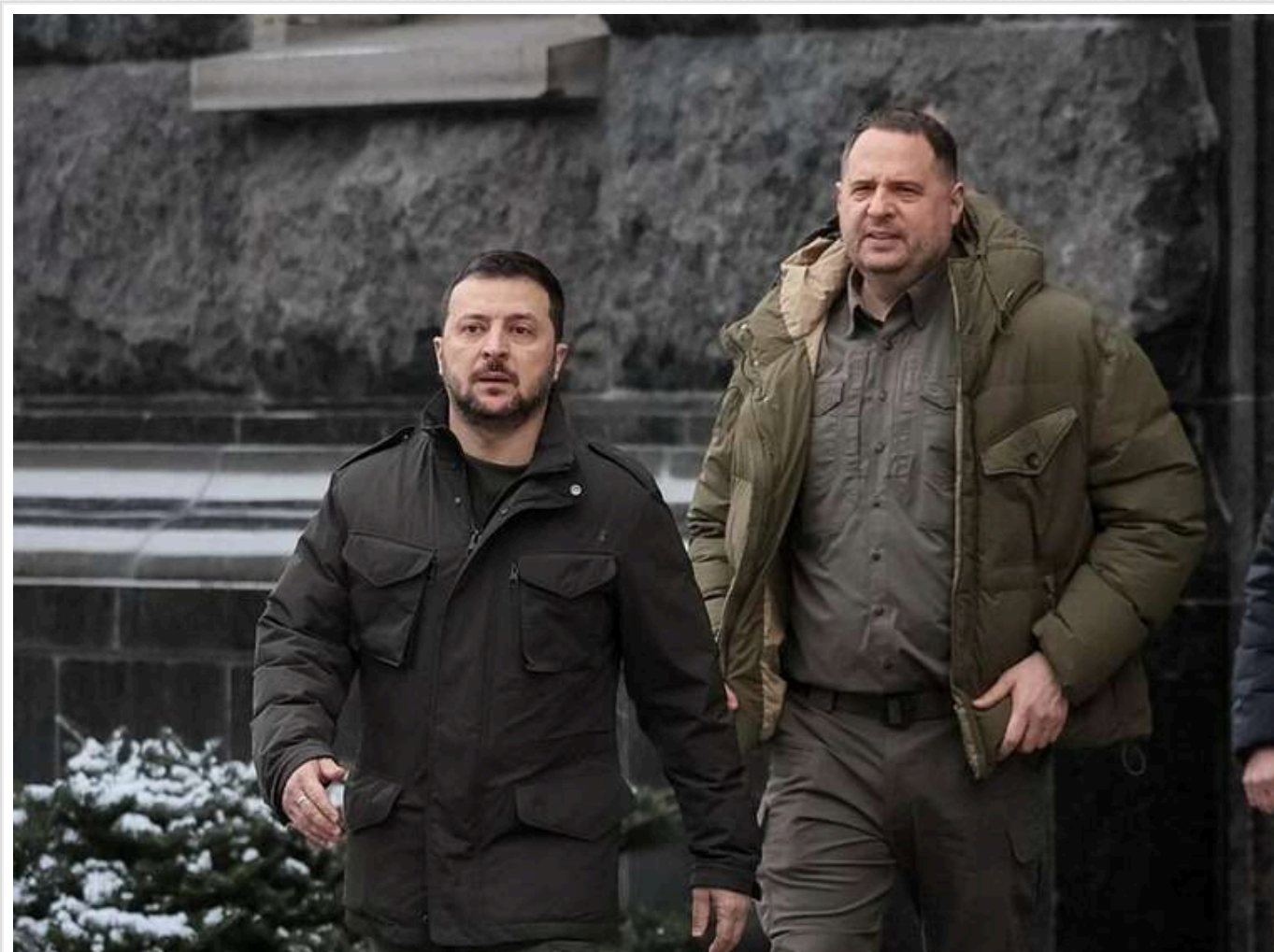
Віяна слів та стратегій: що стоїть за атакою Гетманцева на "банду Єрмака" та планами Генштабу воювати ще три роки

Нинішня політична криза містить дві лінії розколу. Про першу пишуть багато — це протистояння між президентом і його урядом, з одного боку, та парламентом, з іншого.