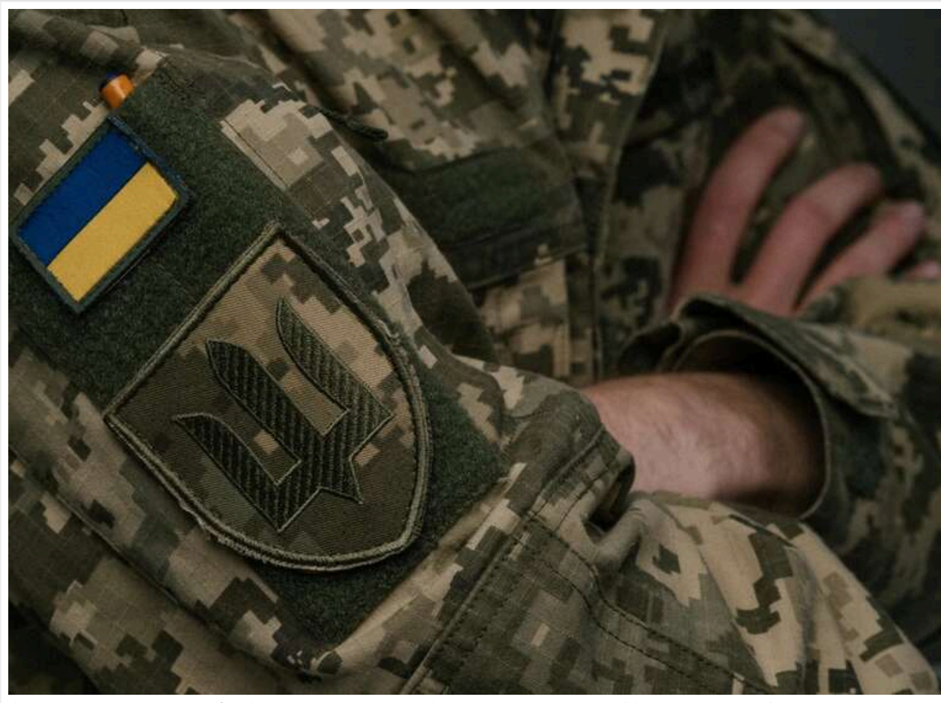
Скарги зросли у 333 рази: як Феміда карає ТЦК штрафами до 34 тисяч гривень за "забудькуватість" і недбалість

Читати на руском Read in English Додати як бажане джерело в Google