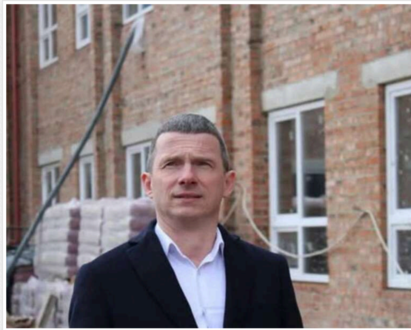
Вето на паузі: як Садовий та депутати «дозволили» родині Доманського забудувати Брюховичі

Скільки коштує вето Садового: у Брюховичах вдруге «узаконили» ділянку під забудову для родини Доманського.