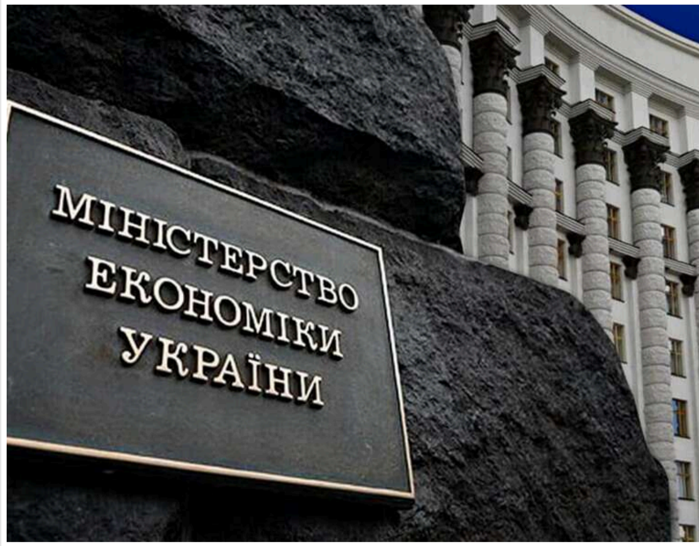
Велика оптимізація: Мінекономіки готує ліквідацію Держгеонадр і Держводагентства задля створення єдиного супервідомства

Читати на руськом Додати як бажане джерело в Google