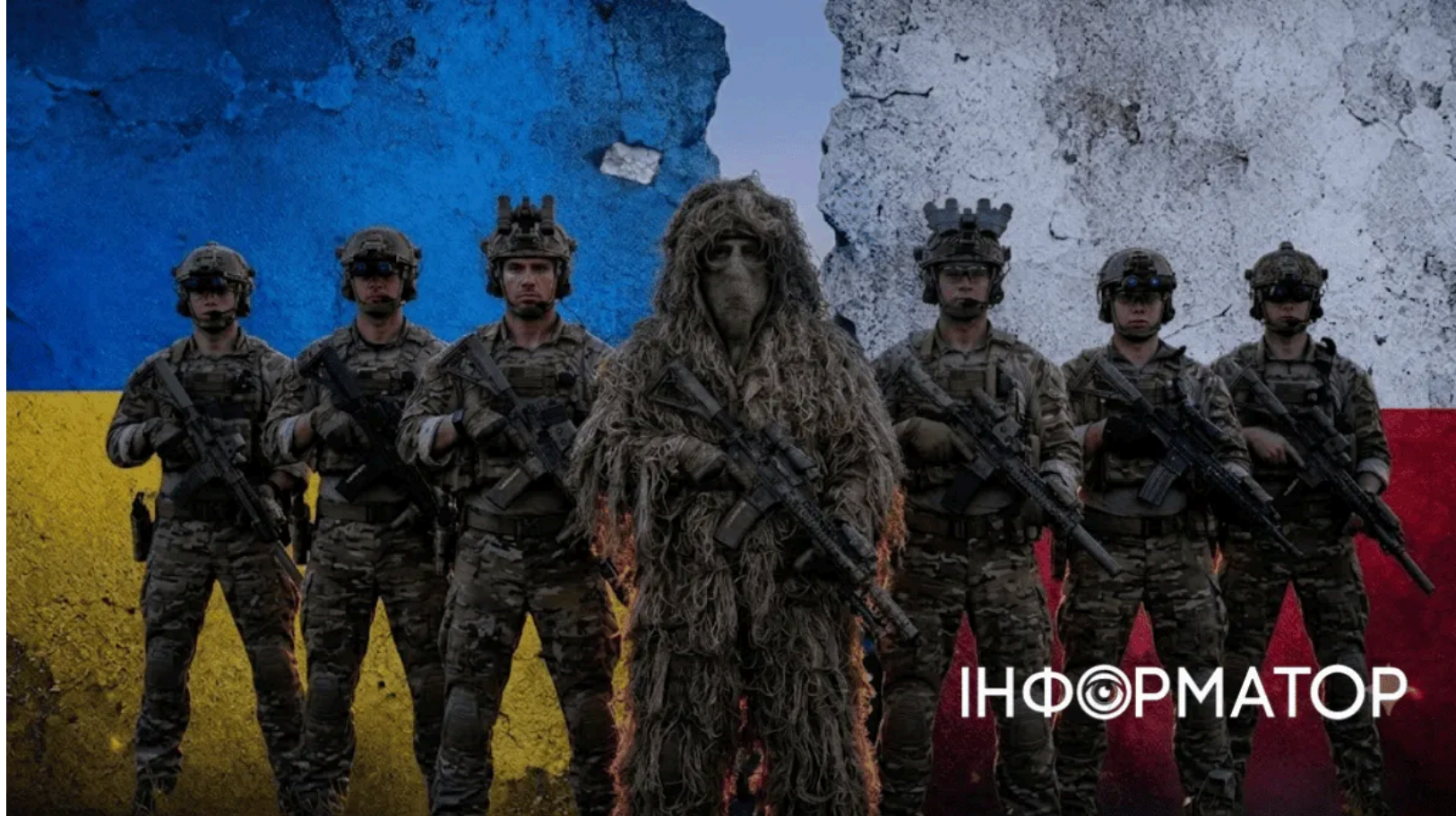
Польський журнал закликав воювати з Україною

Польське правонаціоналістичне видання Myśl Polska опублікувало матеріал, у якому закликає Варшаву переорієнтувати армію з підготовки до протистояння з Росією на "цілком реальну" війну з Україною. Матеріал просуває тезу, що напруженість із українцями є нині вищою, ніж із росіянами, і тому Польщі варто "покращувати відносини з Москвою". Публікація вийшла на тлі найглибшої за роки дипломатичної кризи між Варшавою та Києвом.