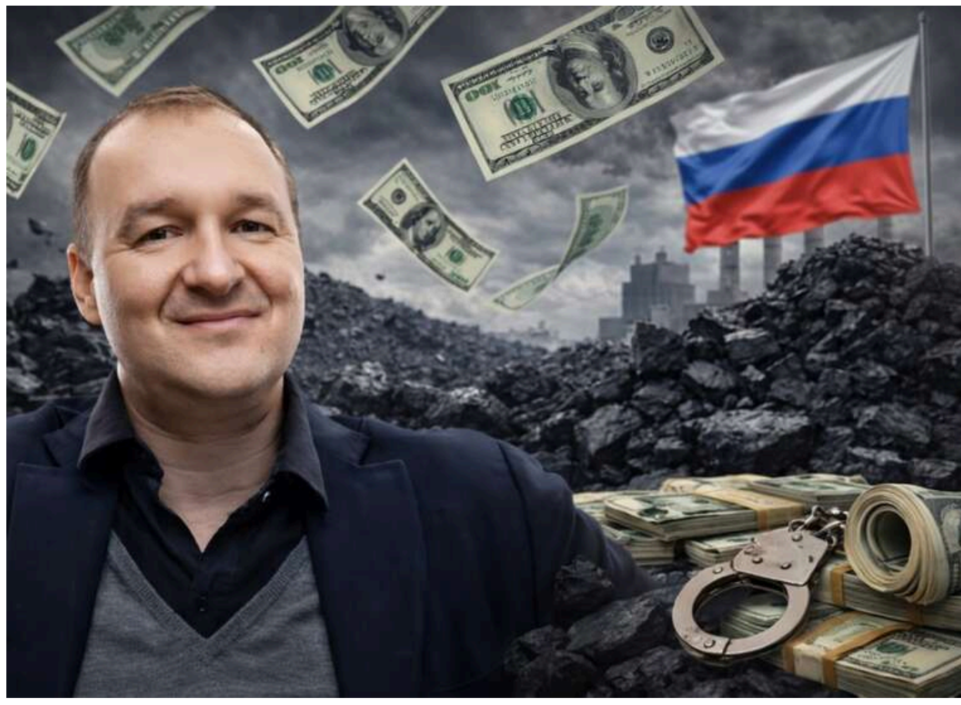
Ефект відбілювання: як Дмитро Коваленко намагається перетворити торгівлю російським вугіллям на "бізнес-героїзм"

Читати на руськом Read in English Додати як бажане джерело в Google