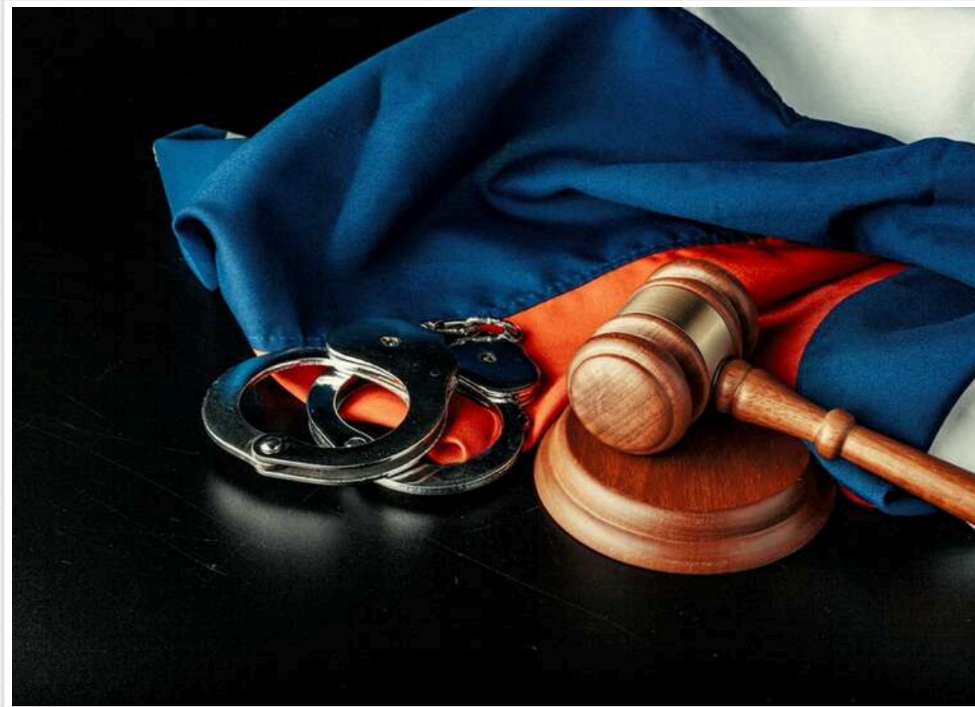
Німеччина, Велика Британія та Молдова приєдналися до угоди про спецтрибунал щодо агресії РФ

Німеччина, Велика Британія та Молдова приєдналися до угоди про створення Спецтрибуналу щодо агресії РФ.