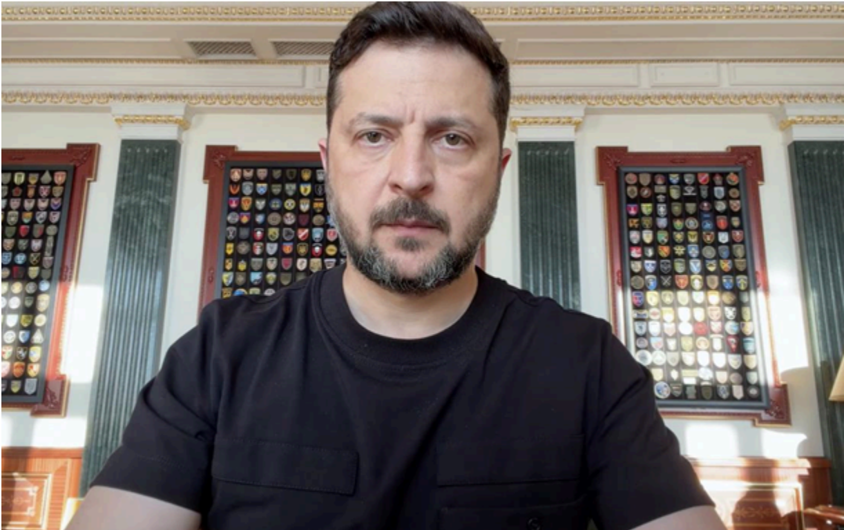
Зеленський прокоментував відносини з Польщею

Президент обговорив із главою уряду завдання на URC 2026, підкресливши важливість конструктиву у відносинах з Польщею.