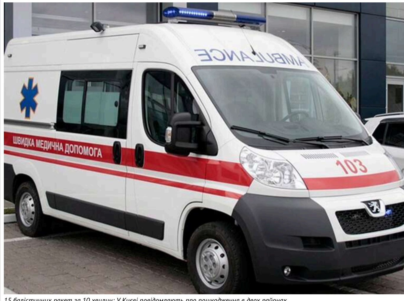
15 балістичних ракет за 10 хвилин: У Києві повідомляють про пошкодження в двох районах