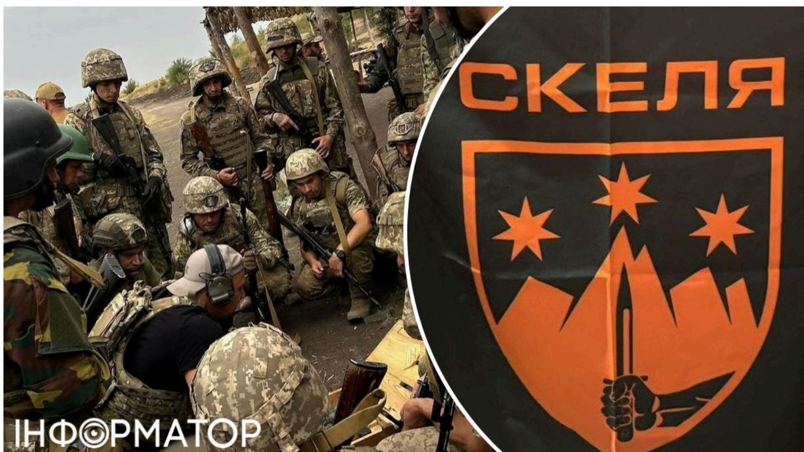
Бабель розкрив знущання і смерті у "Скелі"

За останні пів року в навчальних центрах 425-го окремого штурмового полку "Скеля" загинули щонайменше 26 новобранців - і жоден із них не поліг у бою. Підрозділ неофіційно називають "полком Сирського": він не входить до жодного корпусу й підпорядкований безпосередньо вищому командуванню. Видання "Бабель" оприлюднило масштабне розслідування - і картина, яку описують вцілілі та очевидці, вражає своєю жорстокістю.