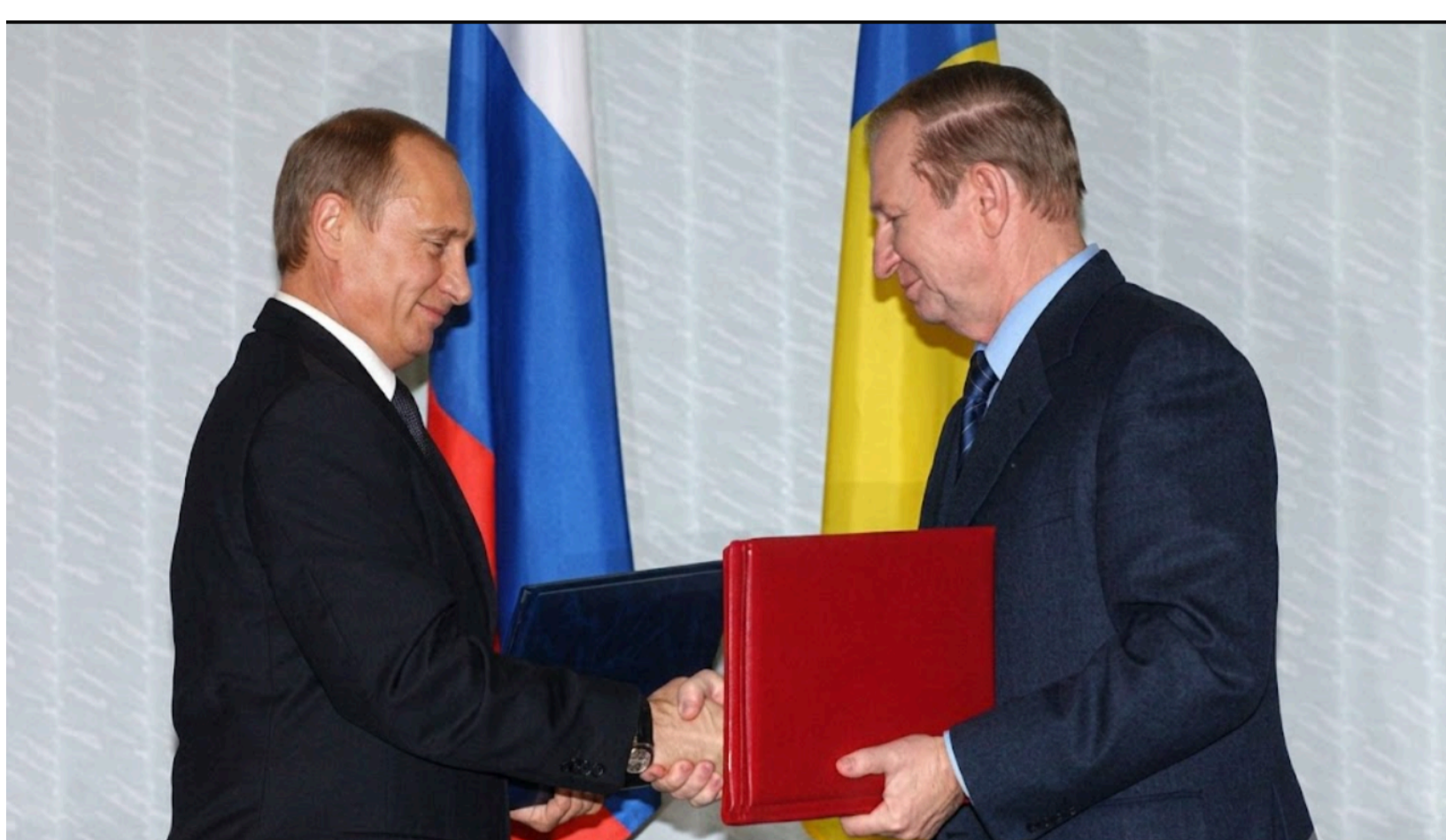
Кого з українських політиків нагородила Росія

Після гучного дипломатичного конфлікту між Україною та Польщею тема державних нагород опинилася в центрі уваги. Частина українських політиків і чиновників почала демонстративно відмовлятися від польських відзнак, але значно менше говорять про тих, хто досі залишається кавалером російських орденів та медалей.