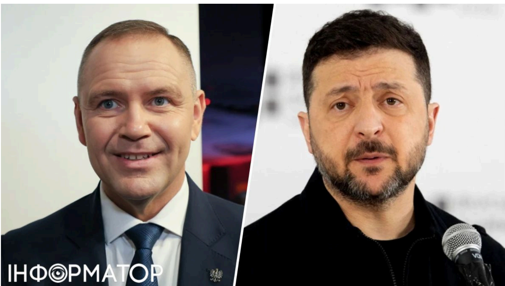
Литва готова примирити Польщу й Україну

Литва готова стати посередником між президентами Польщі та України після дипломатичного скандалу з орденом Білого Орла . Обидві сторони конфлікту "дали себе захопити емоціям", тому Вільнюс бачить для себе роль медіатора, щоб відновити прямий діалог між Варшавою та Києвом. Головна мета - організувати зустріч Кароля Навроцького та Володимира Зеленського, доки напруга не завдала незворотної шкоди регіональному партнерству.