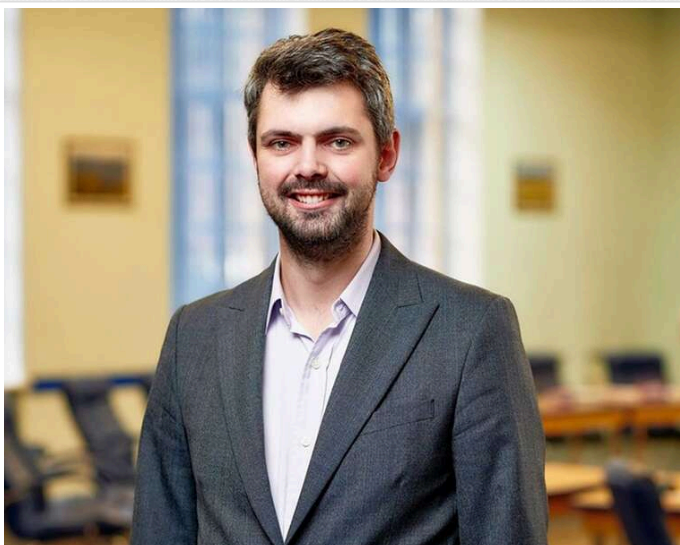
Менше прав – більше контролю: чому пропозиції щодо цензури та призову жінок виглядають як захист владної вертикалі, а не держави

«Військова демократія» Дробовича: узаконення скасування прав під маскою війни.