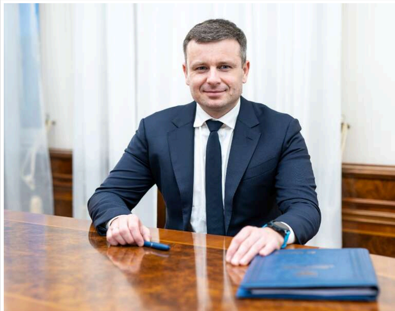
Декларація з «білими плямами»: як міністр фінансів Марченко обзавівся нерухомістю без вказання цін

Міністр фінансів і його «конфіденційна» нерухомість: як Марченко оформлює активи без ціни та відкритості.