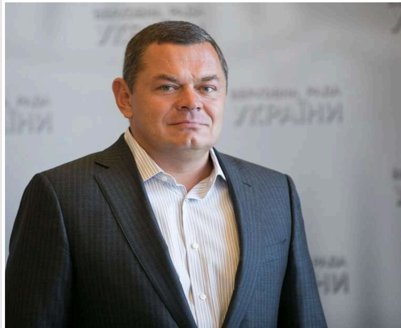
Мандат у Києві, бізнес у Криму, життя в Маямі: як Віталій Борт поєднує статус нардепа з роботою на окупантів

Народний депутат Віталій Борт, який обраний від забороненої ОПЗЖ та входить до групи «Платформа за життя і мир», продовжує поєднувати парламентський мандат з активним життям за межами країни та мережею бізнес-зв'язків, що сягають окупованих територій.