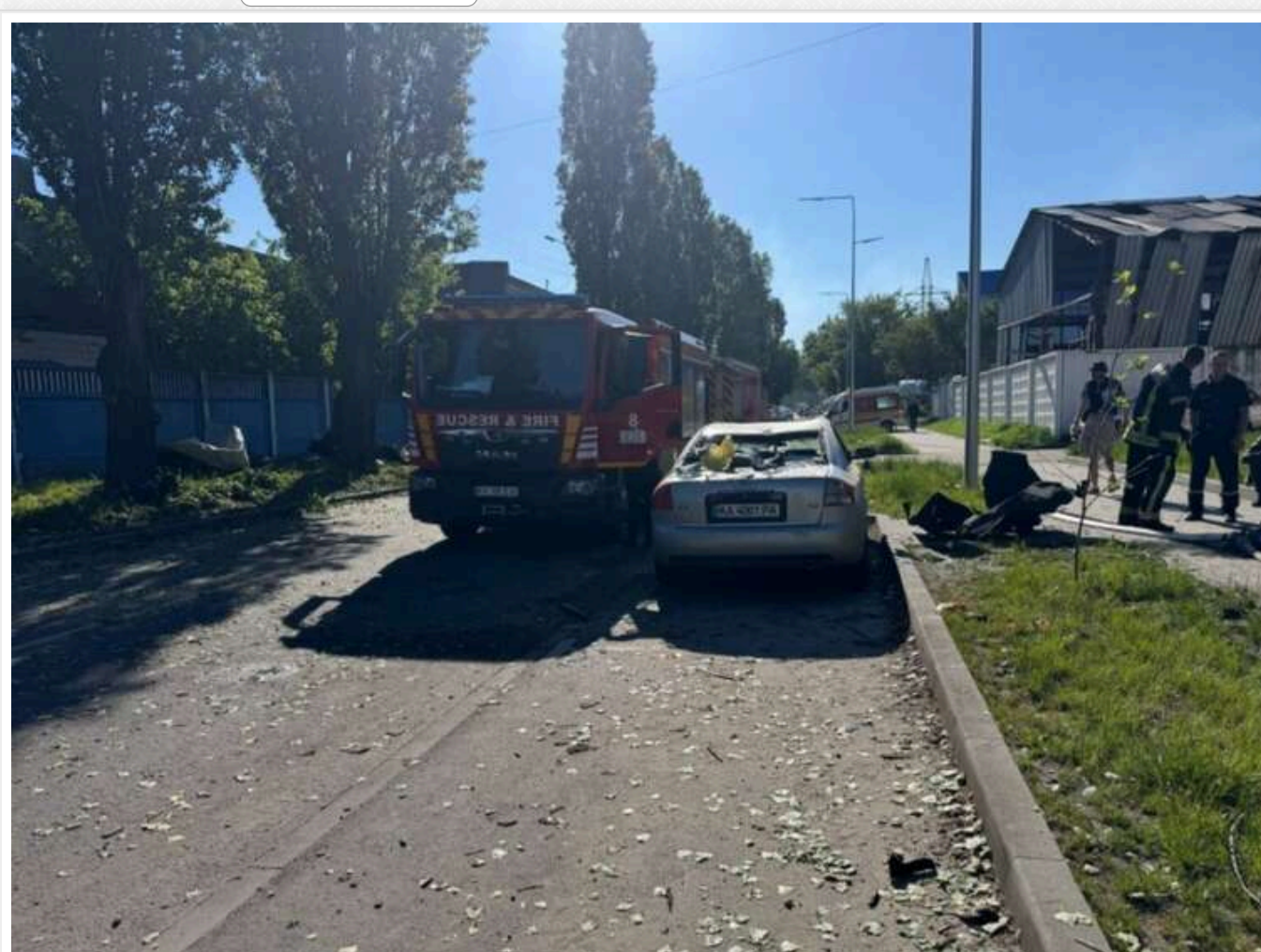
Понад 80 поранених у Києві та знищений ТРЦ «Квадрат»: Україна терміново скликає Радбез ООН через варварський удар РФ

Україна ініціює термінове скликання Радбезу ООН і засідання структур ОБСЄ через нічний удар РФ по Києву, унаслідок якого постраждали понад 80 людей, зокрема діти.