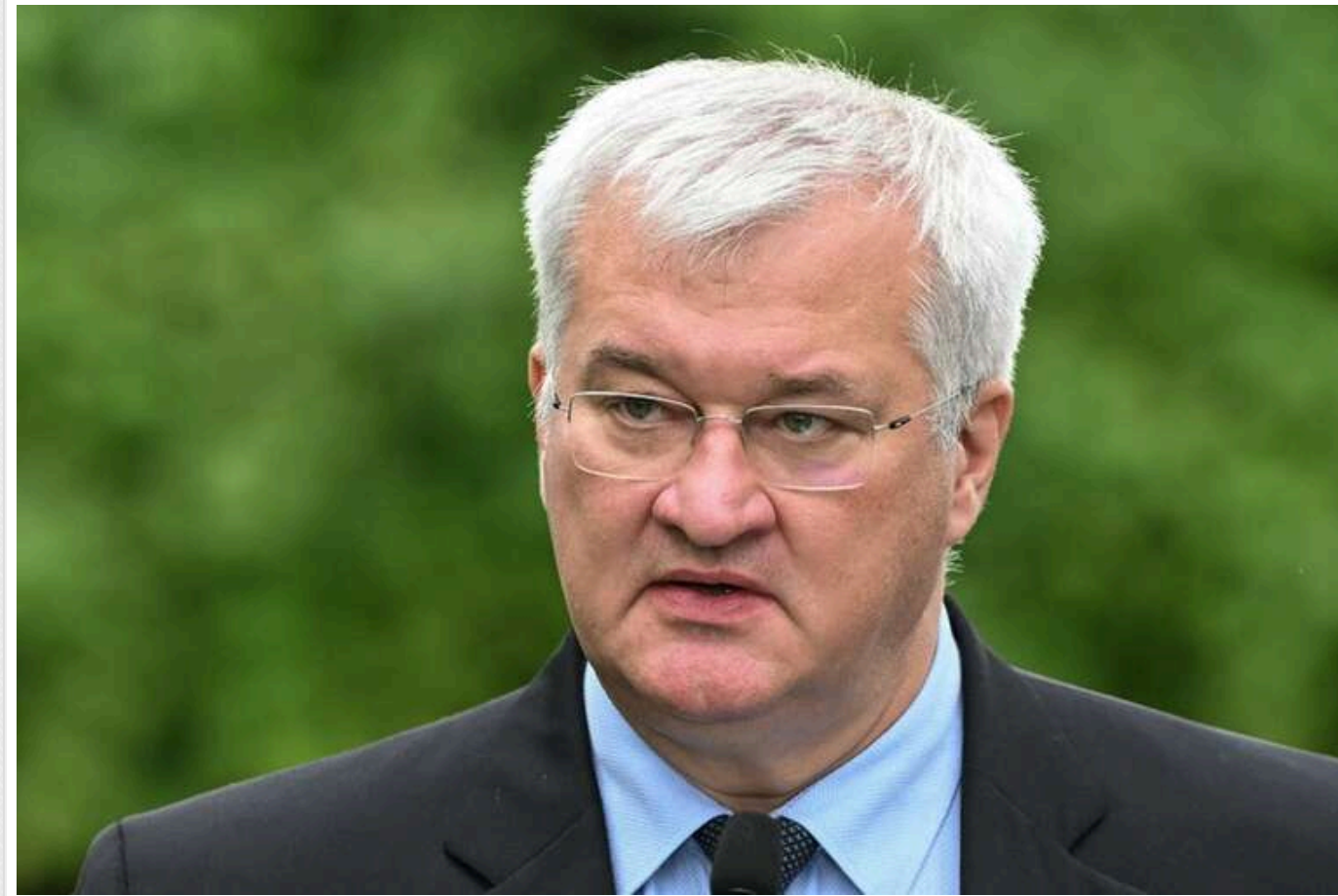
Україна відкриє посольство в Замбії та генконсульство в Кейптауні, – МЗС

Україна планує відкриття посольства в Замбії та Генерального консульства в Кейптауні. Також хочуть розширити співпрацю з африканськими країнами.