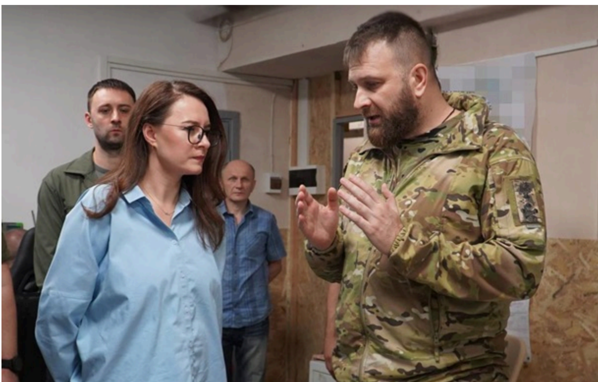
Фото: Юлія Свиріденко/Telegram Прем'єр-міністр Юлія Свиріденко

Кабмін перерозподілив додатково 220 млн гривень спеціального фонду державного бюджету, спрямувавши їх на потреби сектору безпеки і оборони.