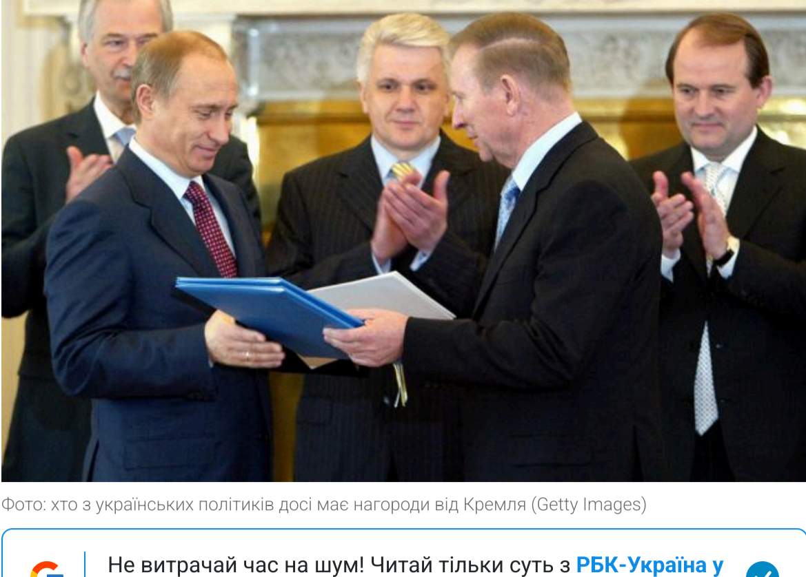
Фото: хто з українських політиків досі має нагороди від Кремля

Не витрачай час на шум! Читай тільки суть з РБК-Україна у Google