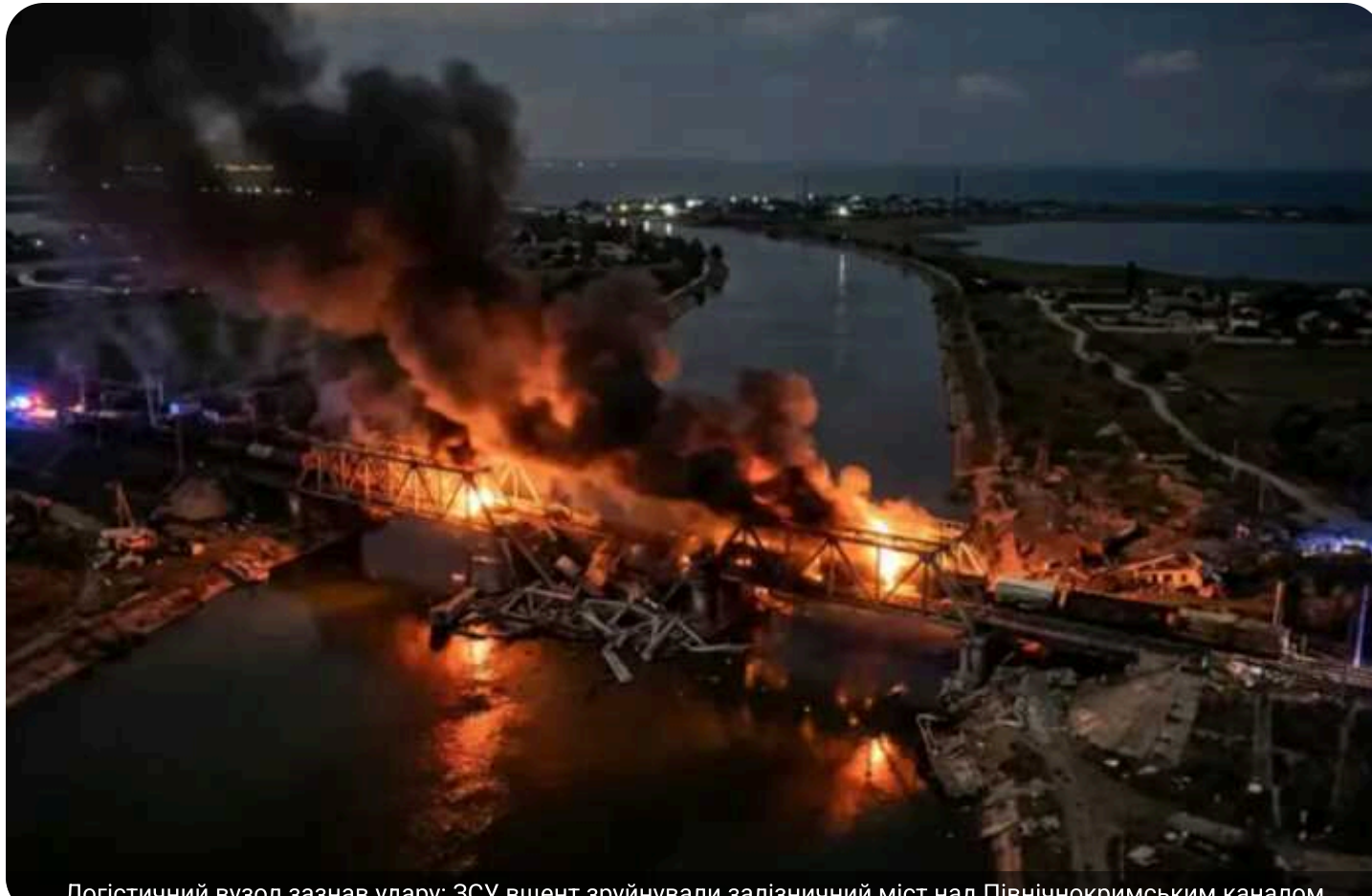
Логістичний вузол зазнав удару: ЗСУ вщент зруйнували залізничний міст над Північнокримським каналом

Сили оборони України успішно нейтралізували залізничний міст через Північнокримський канал, який відіграв критичну роль у логістичному забезпеченні угруповання російських окупаційних сил. Знищення об'єкта суттєво ускладнить постачання ресурсів противника на даному напрямку.