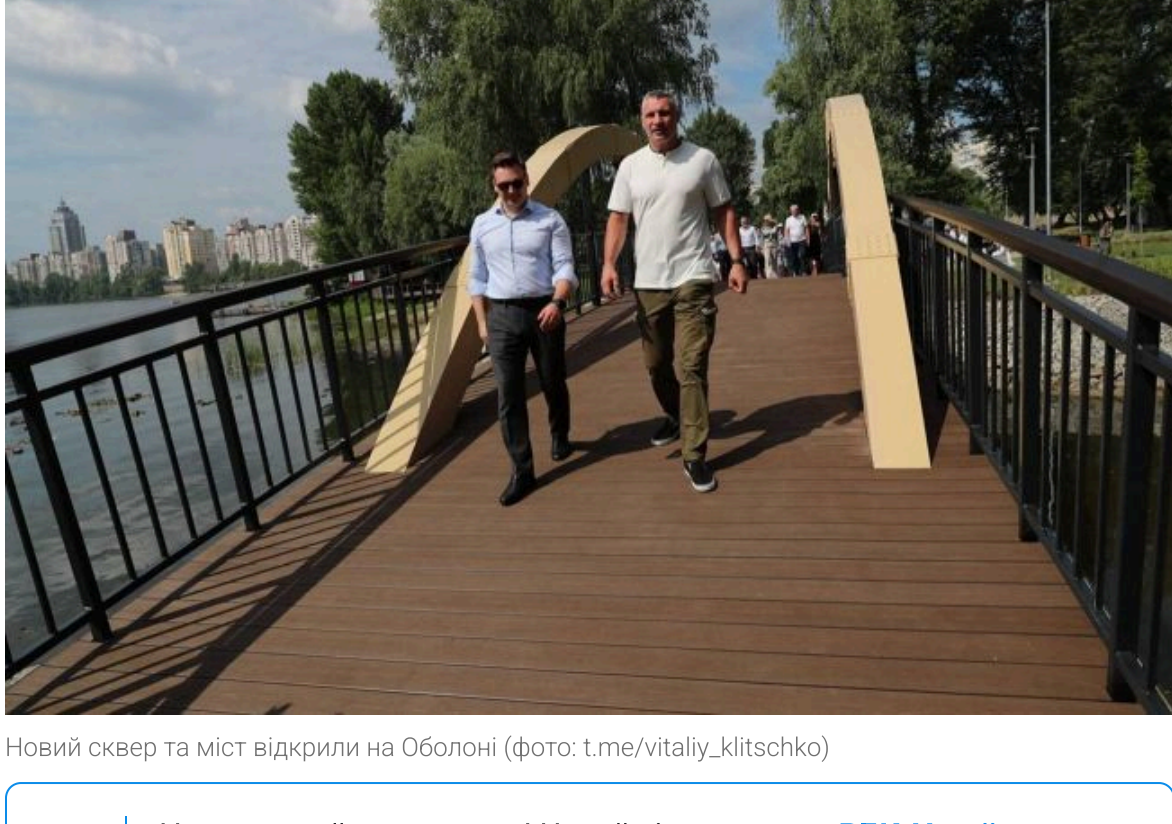
Новий сквер та міст відкрили на Оболоні (фото: L'viv/vitaliy_klitschko)

Не витрачай час на шум! Читай тільки суть з РБК-Україна у Google