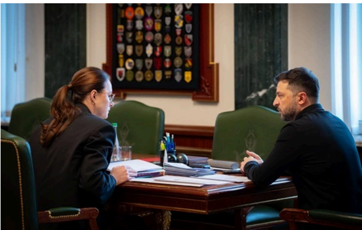
Зеленський вирішив відправити Свириденку у Гданськ

На конференції очікується на підписання низки важливих угод з міжнародними партнерами, зазначила Юлія Свириденко.