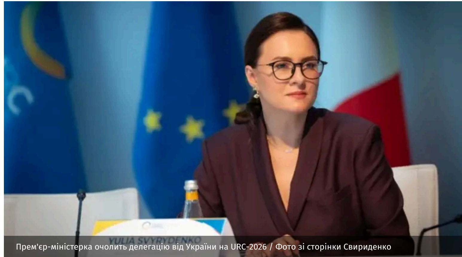
Прем'єр-міністерка очолить делегацію від України на URC-2026

Прем'єр-міністерка України Юлія Свириденко буде на чолі української делегації на URC-2026 у Гданську. На конференції будуть також присутні представники українського бізнесу, керівники державних компаній, представники наших громад з усієї країни та звісно урядовці й парламентарі.