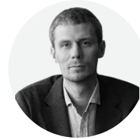
Автор колонки: Ігор Ільченко

Повномасштабна війна дуже сильно змінила роботу соціальної сфери. Сьогодні фахівці супроводжують більше сімей, працюють із наслідками травматичного досвіду, підтримують дітей і дорослих, які опинилися у складних життєвих обставинах.