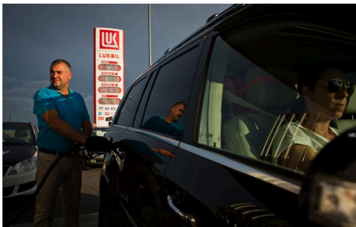
Фото: Росія задумалася про імпорту бензину через удари по НПЗ та дефіцит палива