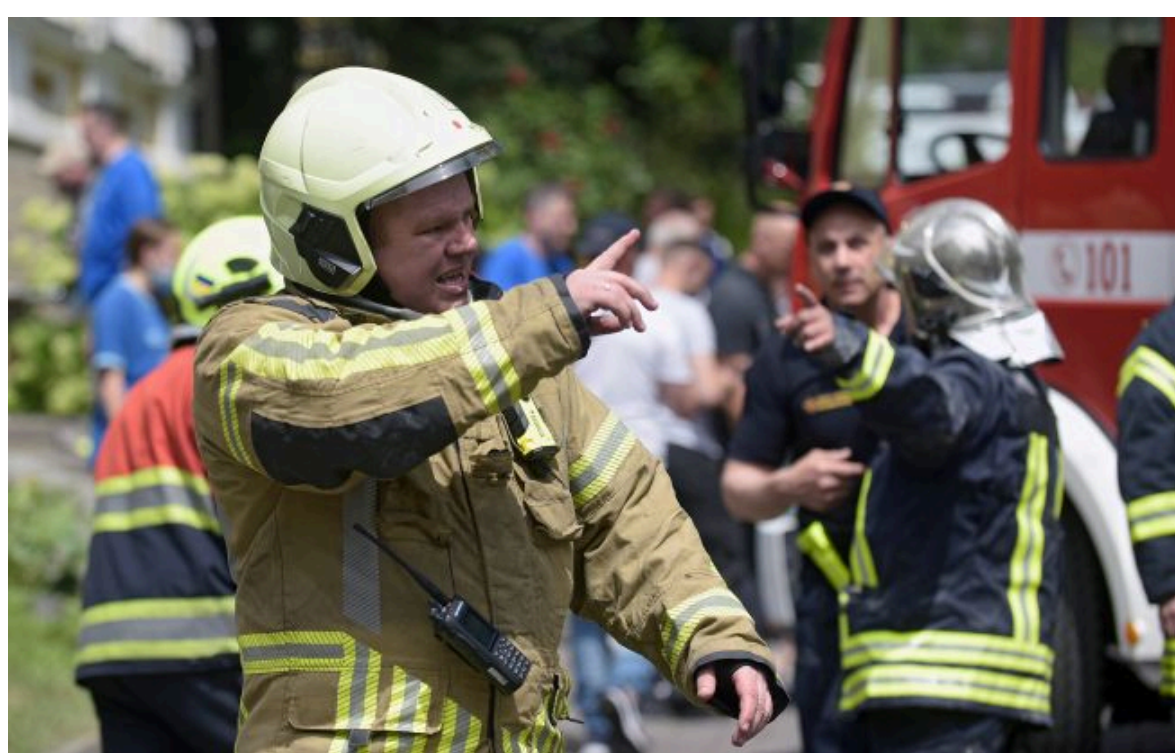
Фото ілюстративне: РФ вдарила балістикою по Кривому Рогу