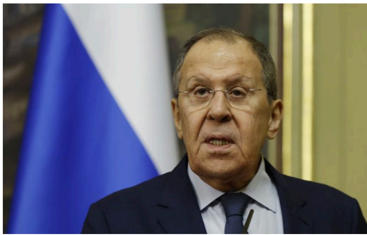
Фото: голова МЗС Росії Сергій Лавров (Getty Images)