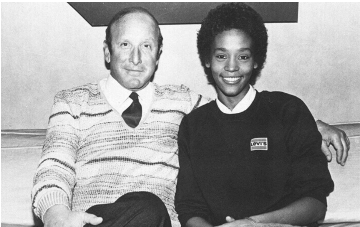
Клаїв Девіс і юна Вітні Г'юстон

Клаїв Девіс залишив по собі спадщину, яка вплинула на розвиток сучасної поп- та рок-музики й допомогла відкрити світові цілу плеяду культових артистів.