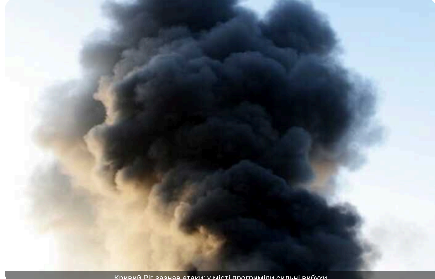
Кривий Ріг зазнав атаки: у місті прогрімали сильні вибухи

У Кривому Розі під час дії повітряної тривоги, оголошеної через загрозу застосування ворогом балістичного озброєння з південного напрямку, пролунали вибухи. Інформація про наслідки та можливі руйнування встановлюється.