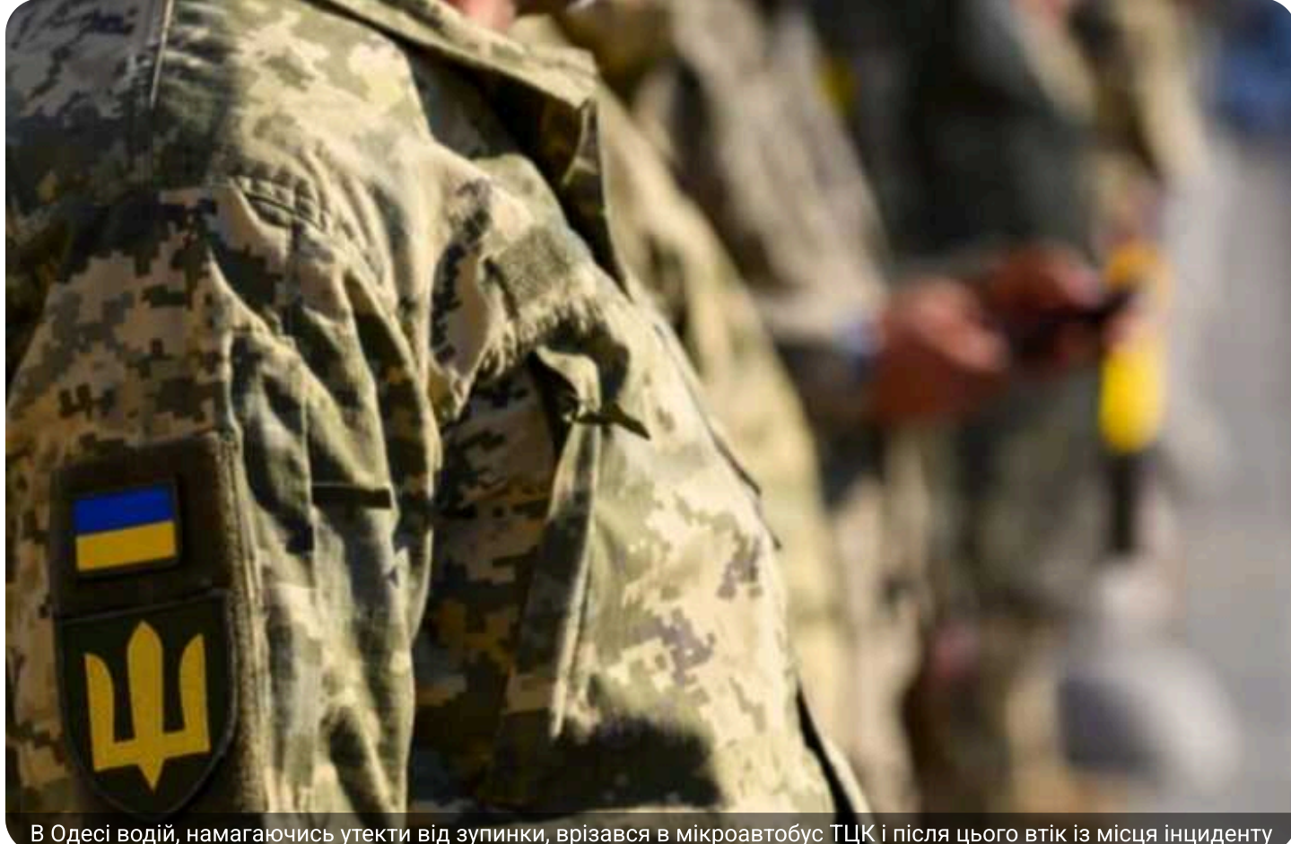
В Одесі водій, намагаючись утекти від зупинки, врізався в мікроавтобус ТЦК і після цього втік із місця інциденту

В Одесі черговий скандал за участю працівників ТЦК: інцидент на дорозі переріс у справжню гонитву та закінчився аварією. Подія викликала значний резонанс у місті, правоохоронці встановлюють деталі конфлікту.