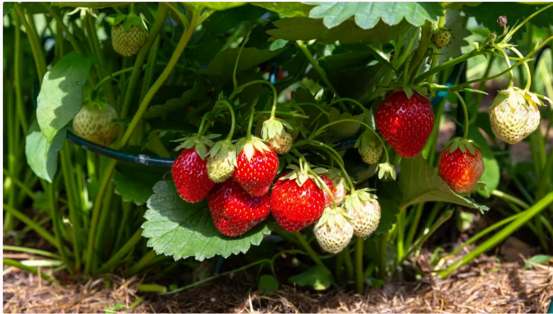
Не варто розраховувати, що зірвана полуниця дозріє

23 червня, 10:18 🗨️ Этот материал также можно прочитать на русском