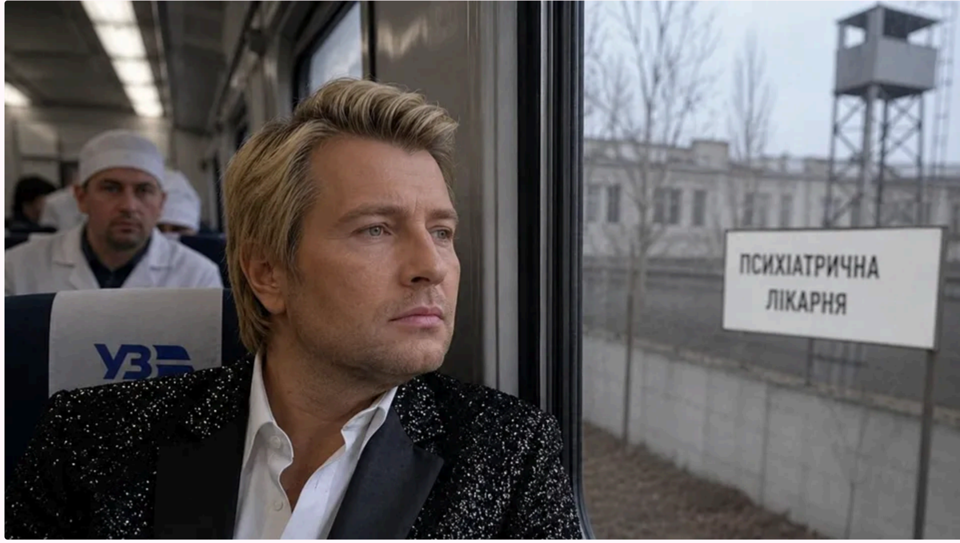
Порада Баскову від "Укрзалізниця" збрала майже 25 тис. уподобань фото згенеровано ШІ на запит сайту "ГОРДОН"

23 червня, 11:12 🗨️ Этот материал также можно прочитать на русском