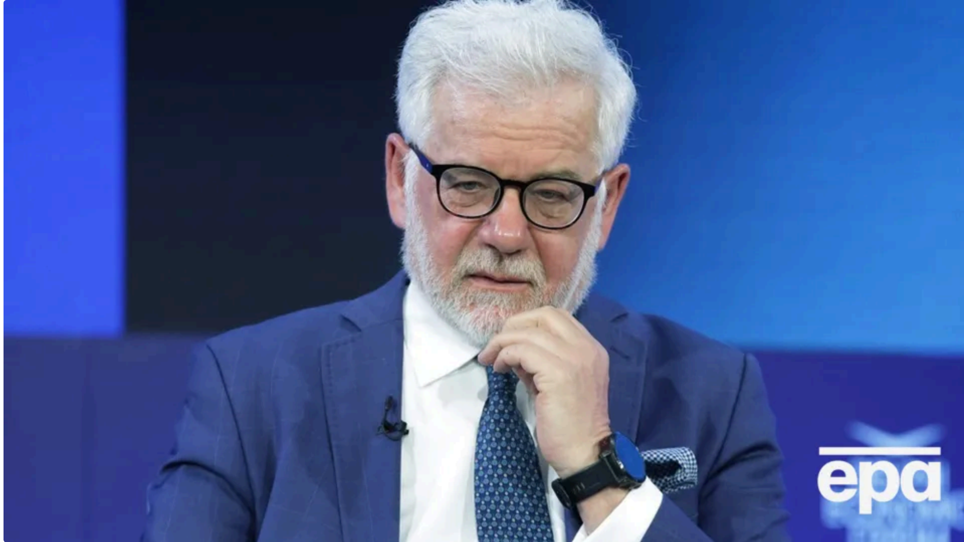
Дипломат вказав на одностайну відмову українських посадовців від польських нагород.

23 червня, 10:57 🗨️ Этот материал также можно прочитать на русском