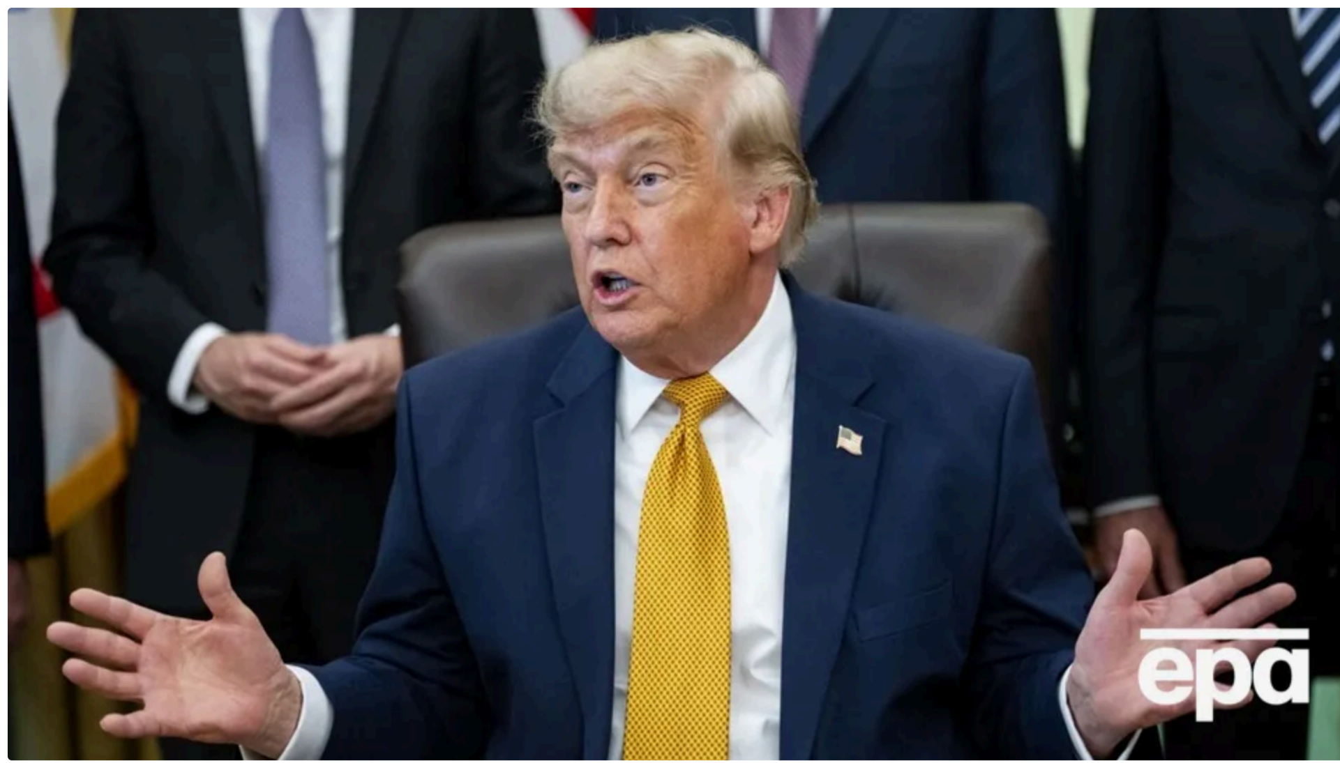
Трамп заявив, що питання ядерної програми Ірану важливіше за світову економічну кризу

23 червня, 09:32 🗨️ Цей матеріал також можна прочитати на руском