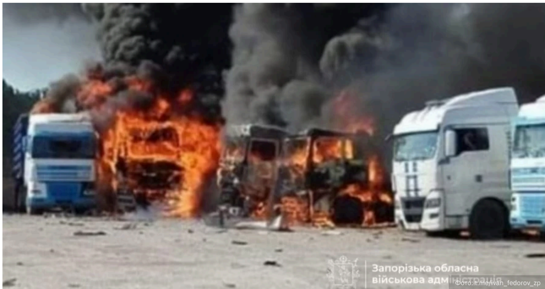
Запорізька обласна військова адм.