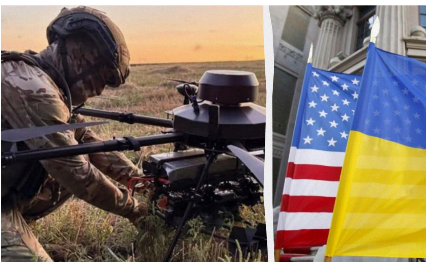
Дрони стали козирем України на переговорах зі США

Україна більше не приходить на міжнародні переговори лише як сторона, яка просить допомоги, а має власні технології і рішення, які стали цікавими для партнерів. Саме розвиток українських дронів-перехоплювачів і досвід у боротьбі з російськими атаками змінили підхід США до співпраці з Києвом, пише Defense News .