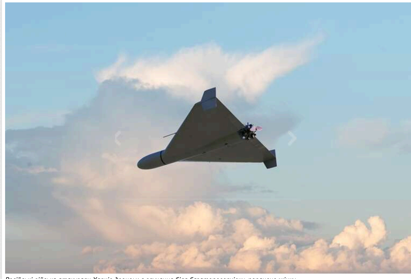
Російські війська атакували Харків дроном: є влучання біля багатоповерхівки, поранено жінку

22 червня російські війська атакували Харків, запустивши ударного дрона по житловому кварталу. За попередніми даними, є травмовані.